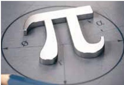
تصویر ۱. ارتباط عدد و دایره

من: «آفرین بچه ها! به شما افتخار می کنم. امروز می خواهیم کمی درباره این عدد صحبت کنیم و بگوییم از کجا آمده است و چه کاربردی دارد. ما تا حالا از این عدد برای محاسبه محیط و مساحت دایره استفاده می کردیم که تصویر ۱ هم به همین موضوع اشاره دارد. حالا ببینیم این عدد پرکاربرد چگونه کشف شده است: