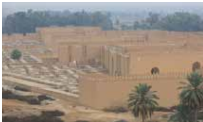
تصویر ۲. قسمتی از تمدن بابل

اولین اطلاعاتی که بشر از کار با عددی مشابه پی دارد، به حدود ۲۰۰۰ سال پیش از میلاد برمی گردد که نشان می دهد بابلی ها با استفاده از آن محاسباتی را انجام می دادند و از آن برای گسترش تمدن و ساخت و ساز (تصویر ۲) بهره می گرفتند.